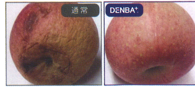
りんごの鮮度比較実験 (4ヵ月)