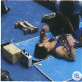
「DENBA Health」の上でマッサージを受ける 体操の回復の姿

2022年4月に右膝前十字じん帯断裂の大ケガを負い、一時は五輪出場も危ぶまれていた岡の大躍進を支えたのは“魔法のマット”だった。